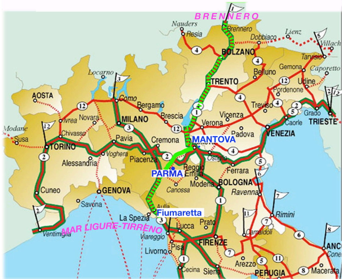
BicitaliaFIAB , la rete ciclabile nazionale: in verde tratteggiato, a nord, dal Brennero a Mantova, la Ciclopista del Sole; a sud da Parma a Fiumaretta-Marina di Carrara, il tratto di "rotta Francigena" (EV5, Bicitalia 3) che riguarda il passo della Cisa, e in verde continuo il trait d'union fra Mantova e Parma. Il tutto compone la cosiddetta TI-BRE dolce.

L'evento consisterà in una cicloescursione cui invitiamo a partecipare numerosi, al seguito dei gruppi FIAB locali, tutti gli appassionati di cicloturismo e ciclovaggi, e tutti coloro cui sta a cuore la mobilità dolce, il turismo ecosostenibile e la valorizzazione dei paesaggi culturali a scala geografica dalla Pianura agli Appennini al Mare, compiendo, in gruppo, in bicicletta e in bici+treno, almeno un tratto significativo del percorso, che si snoda in sequenza da Verona a Mantova (lungo la ciclabile del Mincio), da Mantova a Parma –passando per Sabbioneta, Colorno, Vedole, Torrile – , da Parma a Fornovo, a Berceto –passando per Sala Baganza-Parco regionale Boschi di Carrega, Fornovo – , da Berceto al Mare –passando per il valico della Cisa, Pontremoli, Aulla, S. Stefano Magra, Sarzana– per giungere a Fiumaretta e a Marina di Carrara, dove si concluderà la manifestazione.